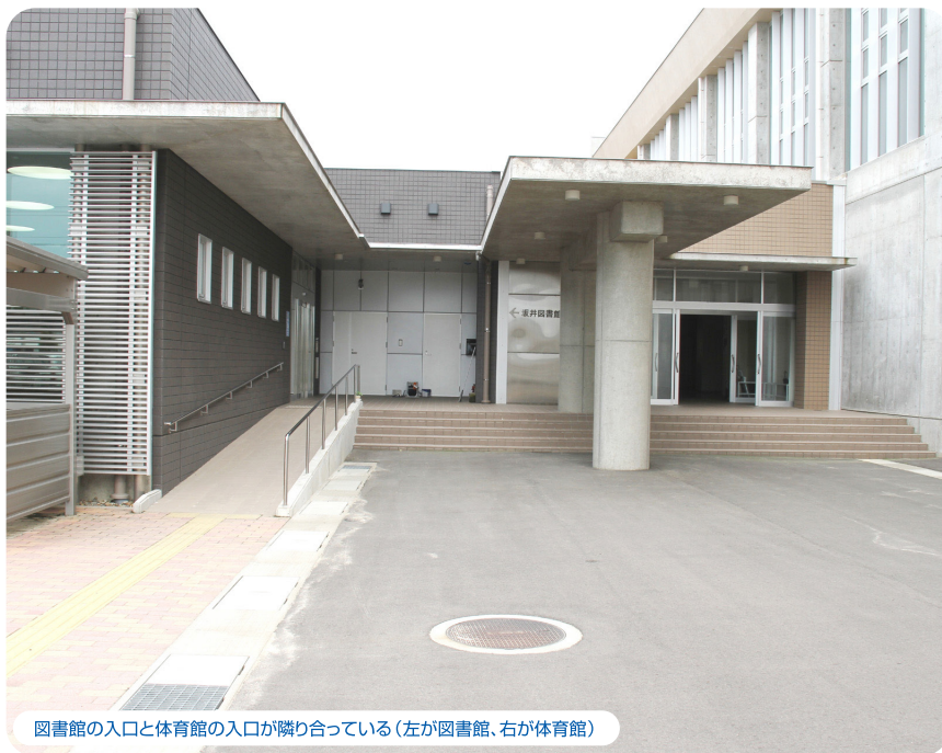
図書館の入口と体育館の入口が隣り合っている(左が図書館、右が体育館)

中学校の敷地内にあるため、チャイムなどの音ができるだけ図書館内に響かないよう、防音性を重視したつくりになっています。基本的に窓は二重サッシで、場所によっては三重になっているところもあり、館内は静かに過ごせる空間になっています。一般開架室の閲覧席を静かに保つためにレイアウトも工夫しました。旧館では別々の部屋だった一般開架室と幼児室が新館では同じ部屋になったのですが、幼児室と一般開架室の閲覧席の距離をあげ、書架を置くことで、書架と図書による吸音を試みました。どの