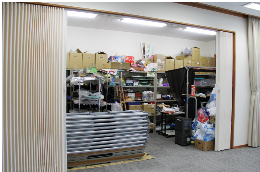
多目的室内に備え付けられている物置

坂井市には「坂井市子どもの読書活動推進計画」というものがあります。この計画は国で制定された「子どもの読書活動の推進に関する法律」に基づき、坂井市の実情を踏まえて作成されたもので、平成21年より実施されています。この計画において、「子どもの読書活動に関する行事や講座などの継続と充実」「すべての子どもたちが自主的に楽しく本に親しめる読書環境の整備」「子どもの読書に関わるボランティアや学校等との連携及び支援センター的機能の充実」「乳幼児期における本と出会う機会の充実」など様々な基本的方策が示されてお