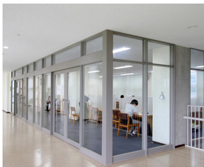
2階 サイレントルーム