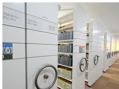
1階書庫の移動式書架。地震対策として免震装置が装備されている

入しました。これは揺れを感じて棚板が自動的に傾斜して図書の落下を抑える機能を備えたものです。1階の移動式書架も免震装置を装備したものを採用しました。