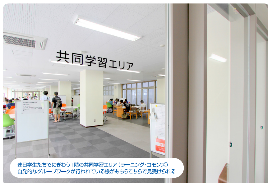
連日学生たちでにぎわう1階の共同学習エリア(ラーニング・commons) 自発的なグループワークが行われている様があちらこちらで見受けられる