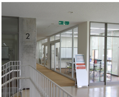
2階 グループ学習室