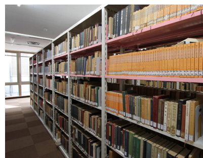
固定書架の上段に取り付けられた「傾斜スライド棚」(ピンク色の部分)。地震のときの本の落下を防ぐ

既存図書館を取り囲むように南側と西側を拡張する形で増築をしました。増築部分は主に共同学習エリアとし、既存部分は書架を中心とした従来の図書館機能や貴重書の収蔵機能に特化しました。おかげで収容能力は1.5倍に増え、それまでの床積みの図書の問題も解消されました。今回のリニューアルは耐震補強という目的もありましたので地震対策には気を配りました。3年前の東日本大震災の時にはほとんどの図書が落下してしまいました。学生ボランティアの力を借りながら復旧作業を行い、ようやく1か月後に開架部分のみ開館できたのですが、閉架書架部分は引き続き復旧作業が継続されました。この経験を踏まえて書架の上段は「傾斜スライド棚」を導入しました。