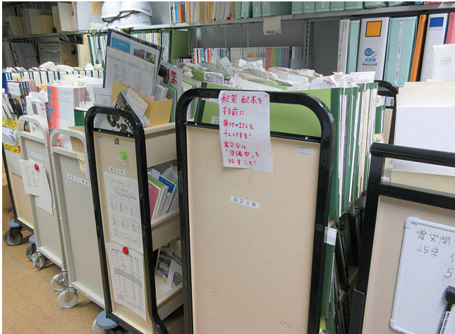
バックヤードにある未整理の資料 専任職員がいるのは他館に比べれば恵まれているものの、震災文庫と震災アーカイブを運営していくためには、人手が足りているとは言えない