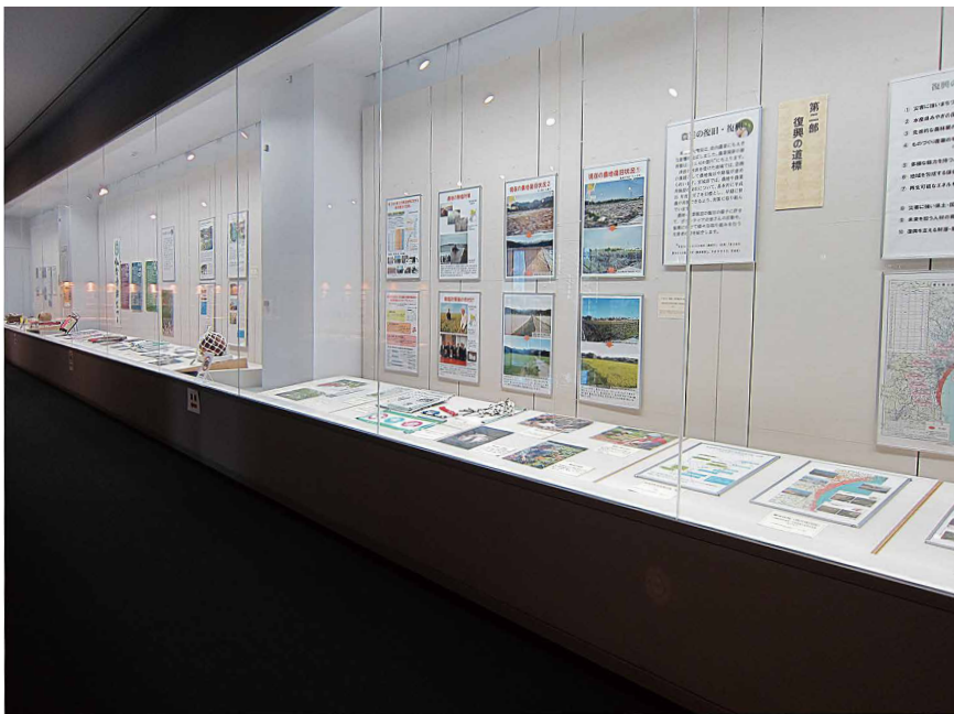
館内2階展示室にて年に一度行う「東日本大震災文庫展」の様子

原資料とデジタル資料。館内の震災文庫とインターネット上の震災アーカイブ。保存している資料の種類や場所は