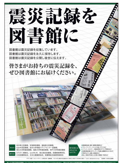
震災記録の収集・公開の重要性を訴える 図書館共同キャンペーン「震災記録を図書館に」 (2012年3月から実施)

岩手県立図書館、宮城県図書館、福島県立図書館、 仙台市民図書館、岩手大学図書館、東北大学附属 図書館、福島大学附属図書館、神戸大学附属図書館の 計8館が呼びかけ団体として名を連ねる