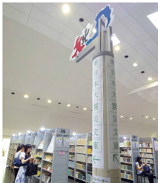
東日本大震災文庫の他にも、貸し出し可能な東日本大震災関連図書をまとめたコーナーもある

難しい状況です。体系的に「まとめる」というのは労力、場所、人、お金がかかること。規模の小さい市町村立図書館では、多くの場合、震災関連資料を郷土資料のひとつとして収集します。だからこそ、当館のように大規模な館が東日本大震災に特化し、体系的な資料の収集・整理・公開を行わなければいけないのでは?と思っています。利用する側としても、一か所に集まっている方が利用しやすいでしょうから。