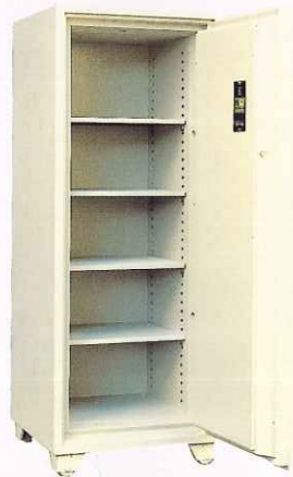
No.300 ②TS ¥316,000 外寸法/610W×640D×1,600H 内寸法/450W×444D×1,360H 内容積/272Q 重量/330kg 附属品/棚板4枚