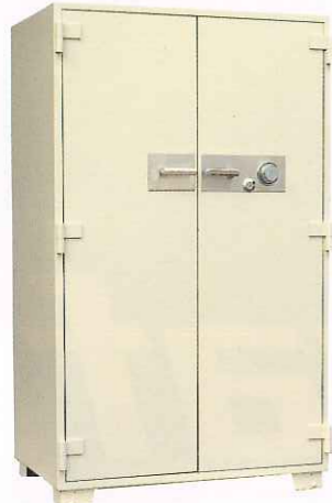
No.100 ②TS ¥592,000 外寸法/1,060W×696D×1,790H 内寸法/900W×500D×1,550H 内容積/698Q 重量/570kg 附属品/棚板5枚