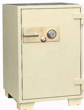
No.600 ②TS ¥212,000 外寸法/610W×640D×930H 内寸法/450W×444D×690H 内容積/138 Q 重量/210kg 附属品/棚板2枚