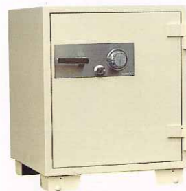
No.700 ②TS ¥200,000 外寸法/610W×640D×750H 内寸法/450W×444D×510H 内容積/102Q 重量/170kg 附属品/棚板1枚