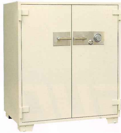
No.200 ②TS ¥433,000 外寸法/1,060W×696D×1,250H 内寸法/900W×500D×1,010H 内容積/455Q 重量/420kg 附属品/棚板3枚