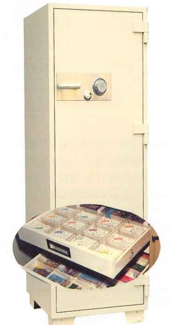
テレカセーフスリム2 ¥690,000 外寸法/600W×680D×1,805H 内寸法/450W×498D×1,575H 内容積/353Q 重量/410kg 附属品/棚板4枚・テレカボックス3セット (1セット=3段引出し)