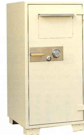
ガード2 ¥415,000 外寸法/610W×640D×1,250H 内寸法/450W×444D×1,010H 内容積/188.4Q 重量/280kg 附属品/棚板1枚 内箱(扉付上下2段保管庫)