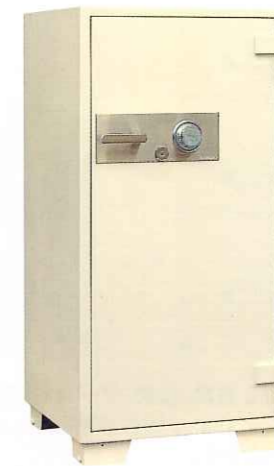
BA5510 ¥431,000 外寸法/610W×640D×1,250H 内寸法/450W×444D×1,010H 内容積/202Q 重量/320kg 附属品/棚板3枚