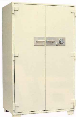
No.100 ②TS ¥592,000 外寸法/1,060W×696D×1,790H 内寸法/900W×500D×1,550H 内容積/698 Q 重量/570kg 附属品/棚板5枚