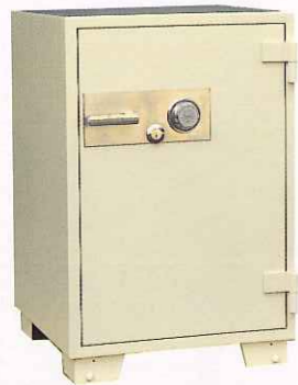
No.600 ②TS ¥212,000 外寸法/610W×640D×930H 内寸法/450W×444D×690H 内容積/138Q 重量/210kg 附属品/棚板2枚