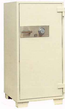
No.500 ②TS ¥248,000 外寸法/610W×640D×1,250H 内寸法/450W×444D×1,010H 内容積/202Q 重量/260kg 附属品/棚板3枚