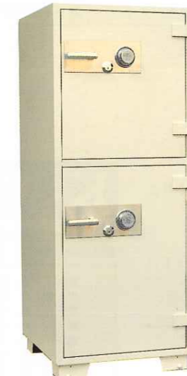
ブラザー2 ¥401,000 外寸法/610W×640D×1,570H 内寸法/450W×444D×1,330H 内容積/上段61.13Q 下段137.8Q 重量/340kg 附属品/棚板2枚