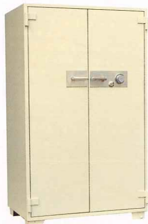
S-10 ①TS ¥342,000 外寸法/1,056W×641D×1,810H 内寸法/916W×472D×1,590H 内容積/687Q 重量/505kg 附属品/棚板4枚