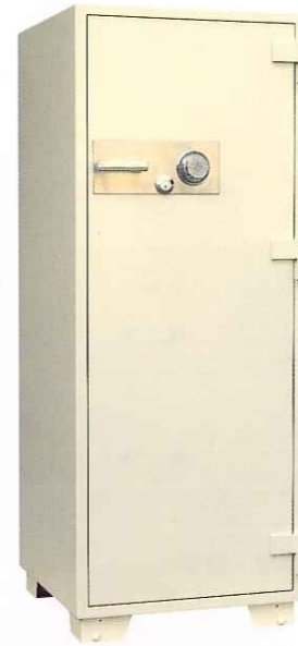
BA3510 ¥511,000 外寸法/610W×640D×1,600H 内寸法/450W×444D×1,360H 内容積/272Q 重量/410kg 附属品/棚板4枚