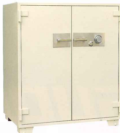
No.200 ②TS ¥433,000 外寸法/1,060W×696D×1,250H 内寸法/900W×500D×1,010H 内容積/455 Q 重量/420kg 附属品/棚板3枚