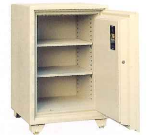
BA6510 ¥373,000 外寸法/610W×640D×930H 内寸法/450W×444D×690H 内容積/138Q 重量/260kg 附属品/棚板2枚