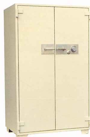
S-10 ①TS ¥342,000 外寸法/1,056W×641D×1,810H 内寸法/916W×472D×1,590H 内容積/687 Q 重量/505kg 附属品/棚板4枚